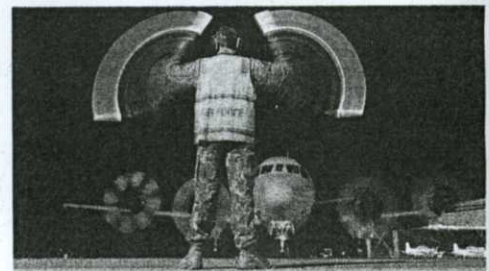
SEORANG anggota Tentera Udara Diraja Australia memberikan isyarat kepada juruterbang pesawat AP-3C Orion di Pangkalan Udara Pearce, Perth semalam.

Sehubungan itu juga Hishammuddin berkata, sebuah kumpulan kerja antarabangsa akan ditubuhkan dengan gabungan agensi-agensinya antarabangsa bagi memperhalusi data-data yang dicerap satelit Inmarsat yang akhirnya bertujuan membawa kepada kedudukan terakhir pesawat MH370.